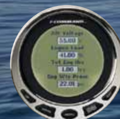
ΘΘΟΝΗ 4 ΕΝΔΕΙΞΕΩΝ