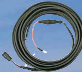
ΚΙΤ ΦΟΡΤΙΣΗΣ ΜΠΑΤΑΡΙΑΣ ΑΞΕΣΟΥΑΡ