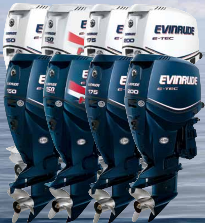
150 150 H.O. 175 200