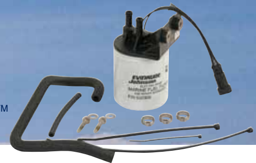
ΦΙΛΤΡΟΥ ΒΕΝΖΙΝΗΣ ΜΕ ΔΙΑΧΩΡΙΣΤΗ ΝΕΡΟΥ