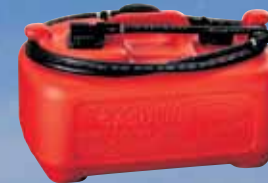
ΔΕΞΑΜΕΝΗ ΚΑΥΣΙΜΟΥ DURA-TANKTM