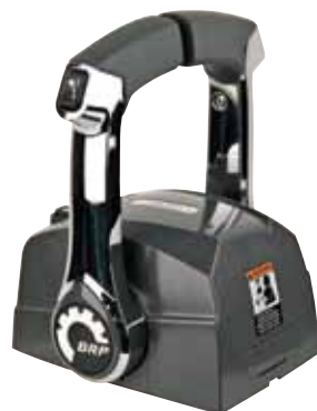
ΔΙΠΛΟ ΕΠΙΚΑΘΗΜΕΝΟ ΧΕΙΡΙΣΤΗΡΙΟ