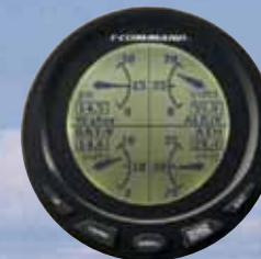
ΘΘΟΝΗ 4 ΕΝΔΕΙΞΕΩΝ