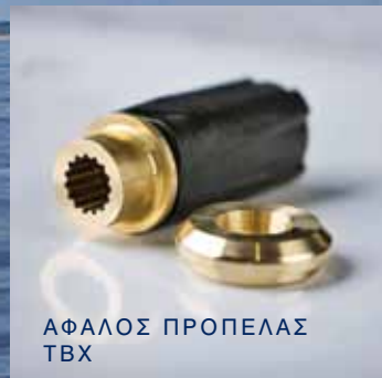
ΑΦΑΛΟΣ ΠΡΟΠΕΛΑΣ TBX