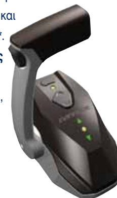
ΧΕΙΡΙΣΤΗΡΙΟ ΕΝΟΣ ΜΟΧΛΟΥ

Evinrude ICON – Βελτιώνουμε τις εμπειρίες σας στο νερό.