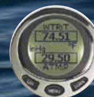
ΘΘΟΝΗ 2 ΕΝΔΕΙΞΕΩΝ