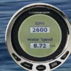
ΘΘΟΝΗ 2 ΕΝΔΕΙΞΕΩΝ