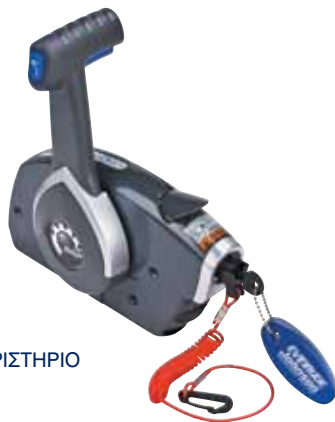
ΠΛΑΪΝΟ ΧΕΙΡΙΣΤΗΡΙΟ ΜΕ ΚΛΕΙΔΙ

Η σειρά χειριστηρίων-μοχλών γκαζιού της BRP έχει σχεδιαστεί με γνώμονα την ακόμα μεγαλύτερη απόλαυσή σας στο νερό. Τα χειριστήρια διαθέτουν εξαιρετική εργονομία και μοναδική ακρίβεια, προσφέροντας ομαλό και εύκολο έλεγχο σε κάθε ταχύτητα.