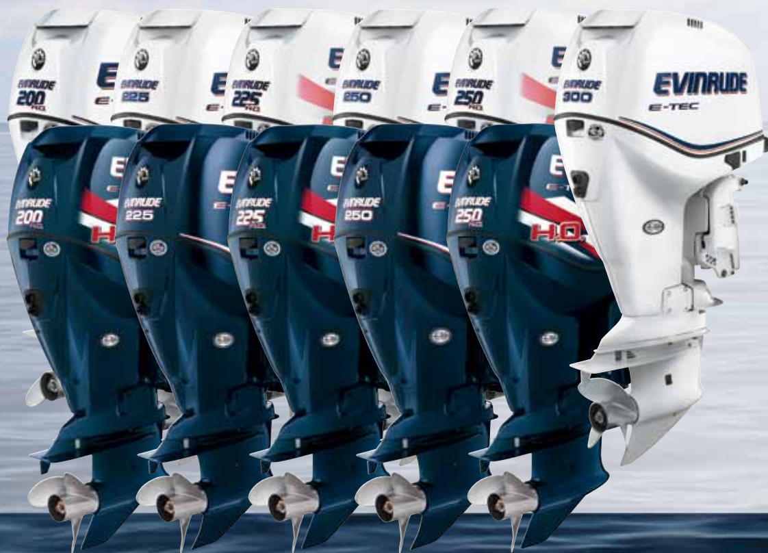
200 H.O. 225 225 H.O. 250 250 H.O. 300