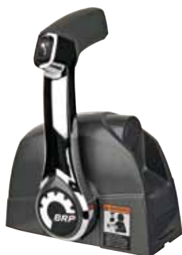
ΕΠΙΚΑΘΗΜΕΝΟ ΧΕΙΡΙΣΤΗΡΙΟ ΧΩΡΙΣ ΚΛΕΙΔΙ