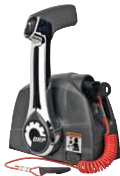
ΕΠΙΚΑΘΗΜΕΝΟ ΧΕΙΡΙΣΤΗΡΙΟ ΜΕ ΚΛΕΙΔΙ