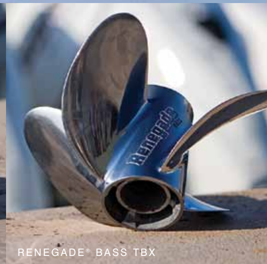
RENEGADE® BASS TBX